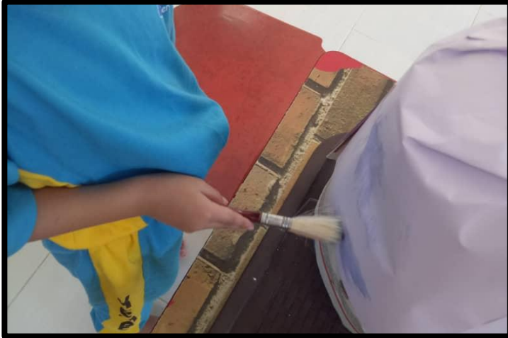
Kanak-kanak mewarna kertas mahjung yang telah siap ditampal seperti warna gunung berapi