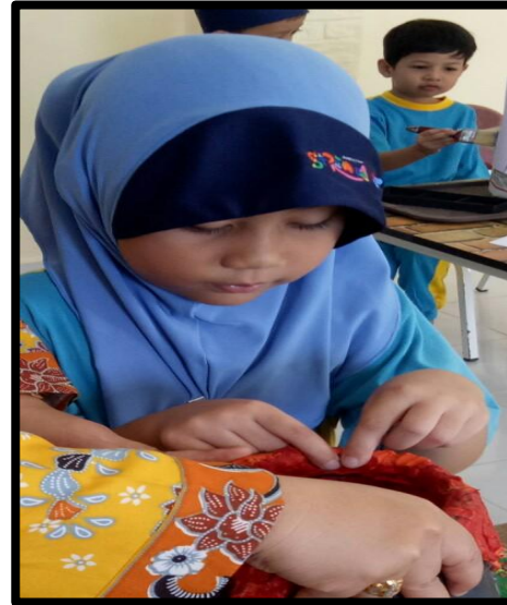
Kanak-kanak menghasilkan lubang letusan gunung berapi di muncung botol mineral